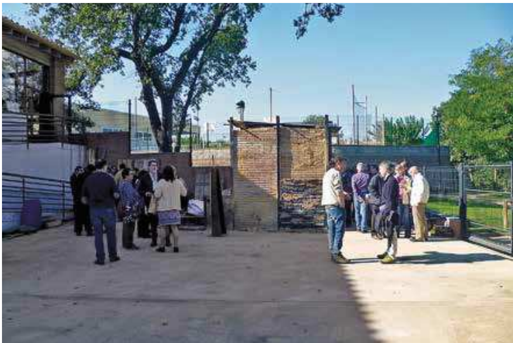
Fig. 5. Visita al horno.