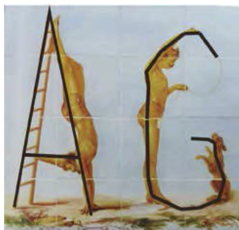
Fig. 6: Iniciales A G.