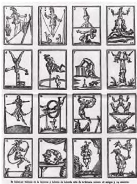
Fig. 10: Aleluya imprenta Laborda.

Respecto a las figuras, la imagen de los rostros es necesario ponerla en relación con el dibujo retrato de Francisco Dasí (Figura 7) que aparece publicado en 1883 en La ilustración valenciana , en el artículo firmado por Jacinto Labaila. La semejanza entre sí de los rostros que utiliza y diseña Dasí conforman una identidad fundamental de sus obras. (Figura 8).