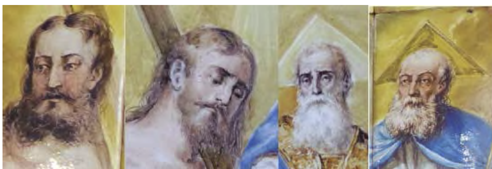
Fig. 15: Comparación rostros de las dos obras sobre la Trinidad.