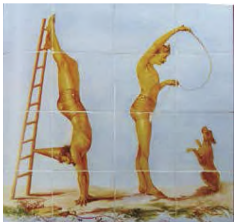
Fig. 5: Panel de los saltimbanquis.