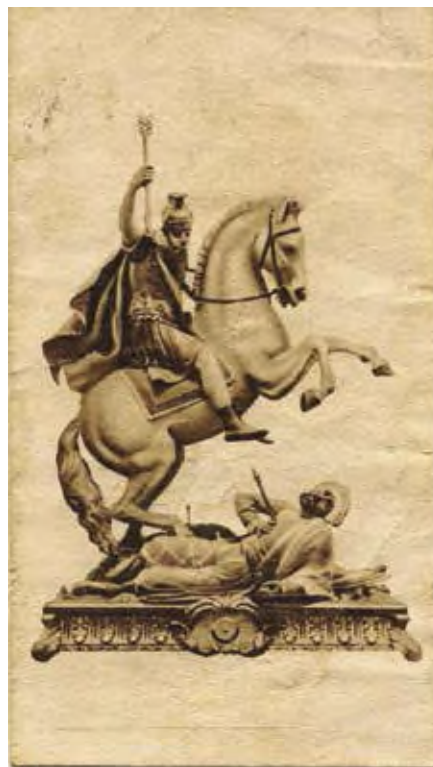
Fig. 3: Escultura 1810.