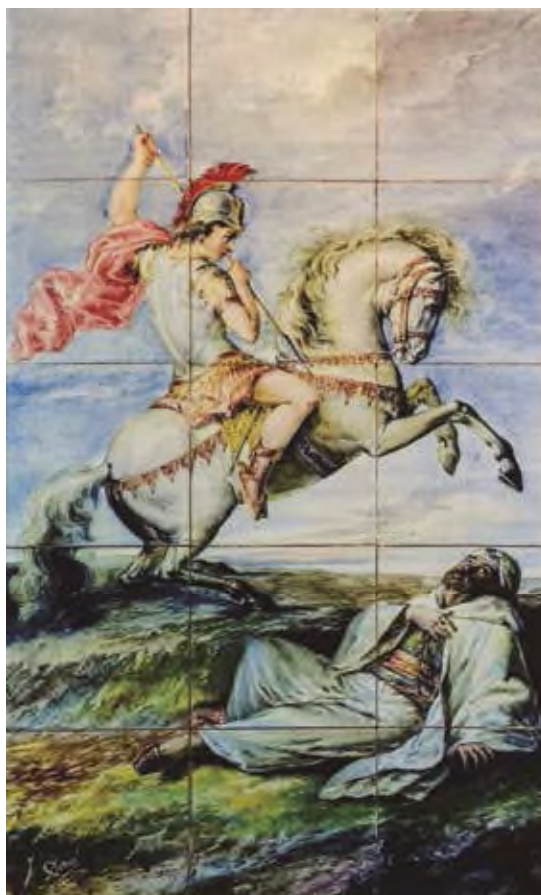
Fig. 1: Panel de Sant Jordi.