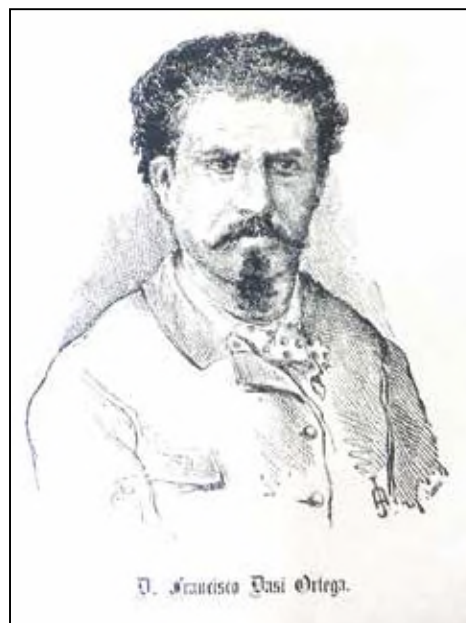
Fig. 7: Retrato de Francisco Dasí publicado en 1883.