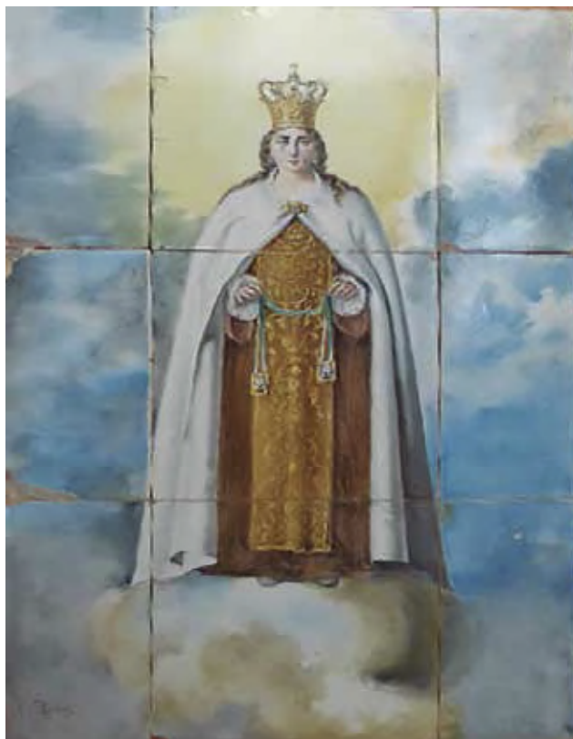
Fig. 9: Panel de azulejos Virgen del Carmen.