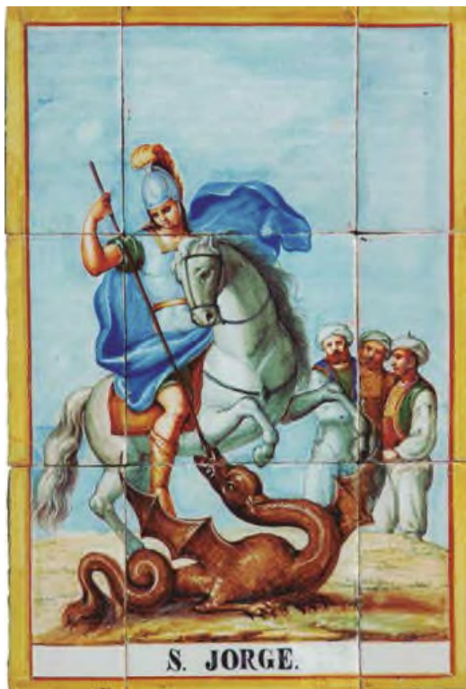
Fig. 2: Panel de azulejos San Jorge, 1860-1870.