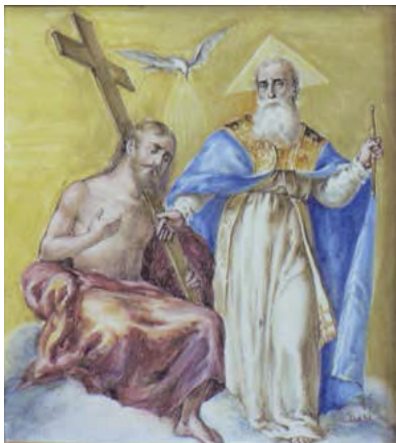
Fig. 14: Azulejo de la Trinidad, Convento de Santa Ana de Jumilla.