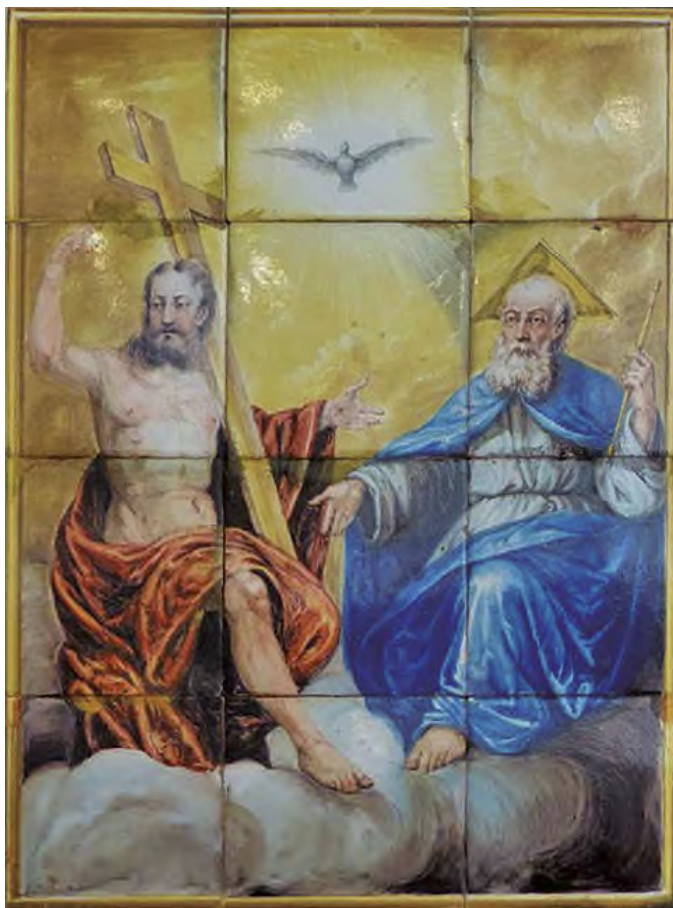
Fig.12: Panel de azulejos de la Santísima Trinidad.