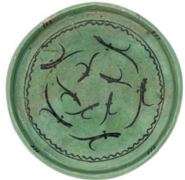
Zafa turquesa con peces en azul. Siglo XIV. Taller: Granada. Loza estannífera con cobre, decorada en cobalto. Museo de la Alhambra.