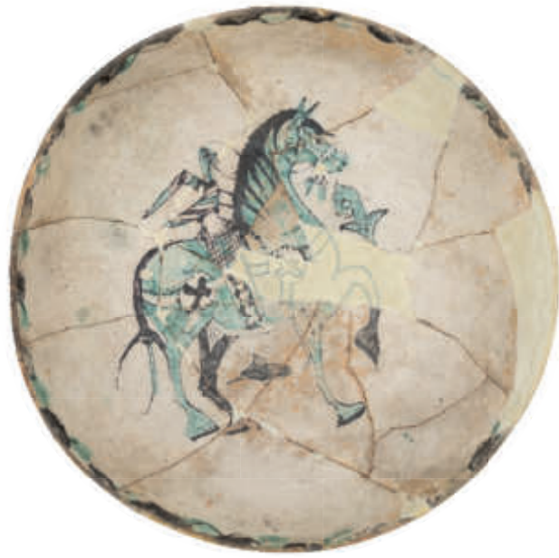
Zafa con caballo. Segunda mitad del siglo X – primera mitad del siglo XI Procedencia: Madīnat Ibbīra, Atarfe (Granada). Loza estannífera decorada en verde y negro. Museo de la Alhambra.

La primera sala, que denominamos sacristía de la capilla, nos sirve para ubicarnos territorial e históricamente en lo que respecta a la finalidad de nuestra exposición. Esta sección inicial es un intento de analizar la evolución desde la conformación de Al-Andalus; atendiendo a los valores comunitarios y de uso que tuvieron los objetos cerámicos y al dominio técnico conseguido previamente.