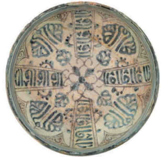
Ataifor/cuenco decorado con hojas radiales en azul y negro. Siglos XIV o XV Taller: Granada. Loza estannífera decorada con óxidos de cobalto y manganeso Museo de la Alhambra.

De hecho, a nivel visual, esta sección se inicia con un eje que enlaza el Jarrón de las Gacelas, obra cumbre que centra la capilla, con imitaciones realizadas a caballo entre los siglos XIX y XX que nos hablan de reconocimiento e imitación técnica en otro contexto cultural diferente. Los tiempos culturales existentes entre la obra maestra nazarí y estas de carácter historicista son los que organizaran esta sala.