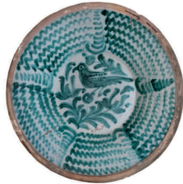
Lebrillo con pájaro en verde. Siglo XIX. Taller: Granada Arcilla torneada vidriada en su interior con blanco estannífero y decorada con óxido de cobre, verde, cocida en horno árabe (monococción) Colección Hermógenes Ruiz y Agustín Morales

Es necesaria reserva previa de plaza. Grupos no superiores a 10 personas. Cada visita tendrá una duración de 45 minutos. Información y reservas en: https://www.alhambra-patronato.es/