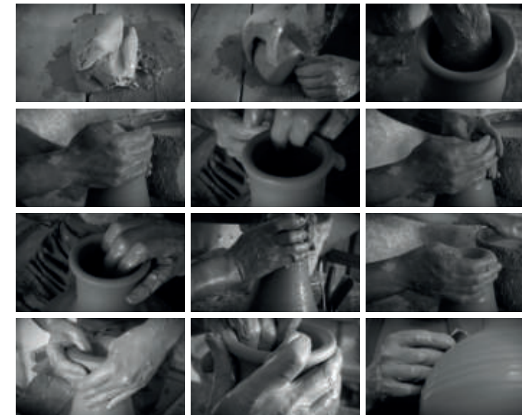
Ceramista. Fotogramas del audiovisual inmersivo.

En paralelo, el catálogo reúne investigaciones de los más cualificados estudiosos del periodo, permitiendo a los interesados profundizar en los distintos aspectos de la historia social, productiva, comercial y técnica que rodean los talleres en el contexto granadino, así como sus relaciones con otros centros productores y otras sociedades reconocedoras de los valores estéticos y utilitarios de nuestra cultura cerámica.